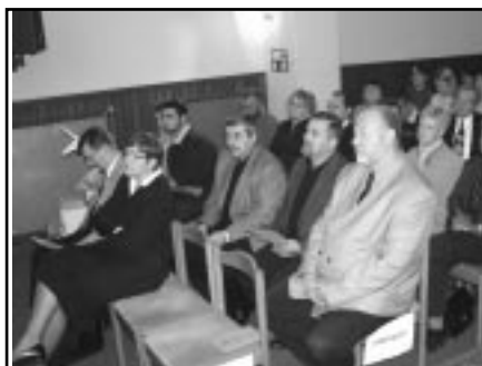
Svečani početak akademske godine