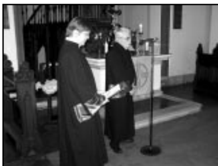
Promocija u Evangeličkoj crkvi

S približavanjem konca 2004. godine raste i potreba za kratkim osvrtom na proteklu godinu koja je za Teološki fakultet "Matija Vlačić Ilirik" bila, u najmanju ruku, izuzetno sadržajna. Kako sažeti sve ono što se zbivalo?