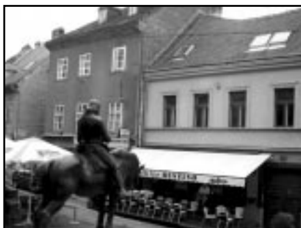
Pogled sa Kamenitih vrata na zgradu Fakulteta