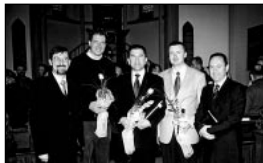
Diplomanti baptisti s članovima Senata